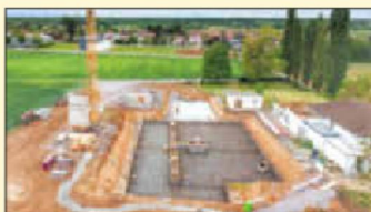
Ansicht nach Süden