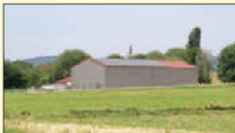
Ansicht nach Westen