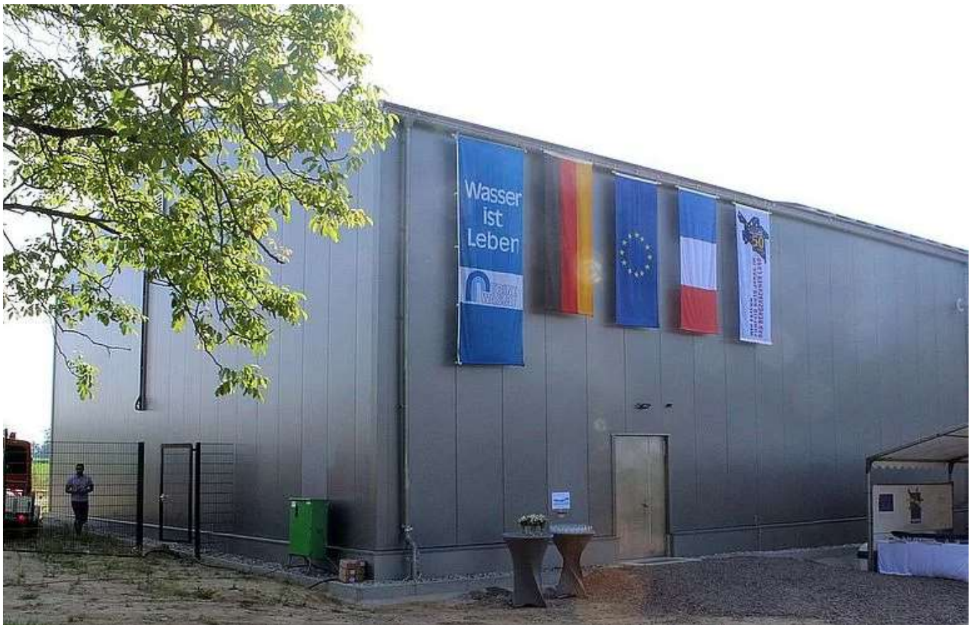
Das neue Wasserwerk in Steinfeld. Kosten. 4,6 Millionen Euro.

21.05.2022 | Top-Nachrichten | Versand-Newsletter | Erstellt von Robert Wilhelm